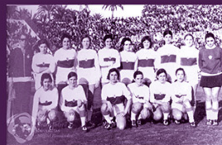
Mujeres jugando al fútbol en el homenaje a Miguel Quirant (23 de febrero de 1971)