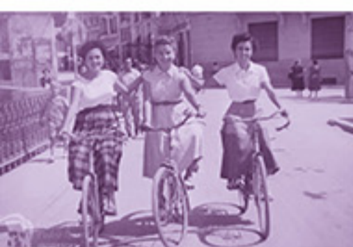
Mujeres ciclistas en el puente de Canalejas