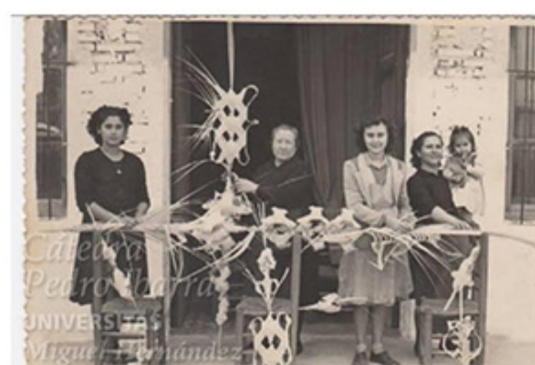
Venta ambulante de Palma Blanca en Alberic (Valencia).