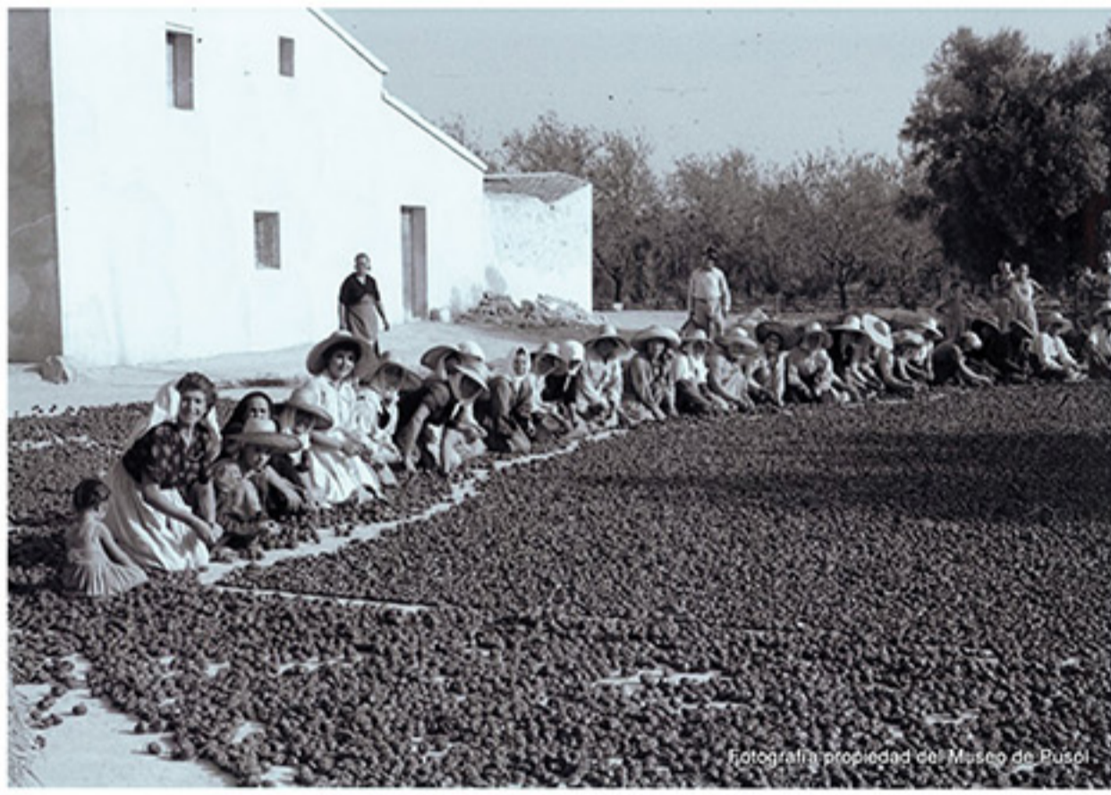
Mujeres seleccionando flores secas en la Marina, años 60. (Asaja Mujeres)

Desde siempre las mujeres del Camp d'Elx han trabajado en actividades agrarias y ganaderas, aunque esas actividades formaban parte de las llamadas "tareas domésticas", hay que reconocer que sin su esfuerzo y contribución muchas explotaciones no habrían perdurado en el tiempo.