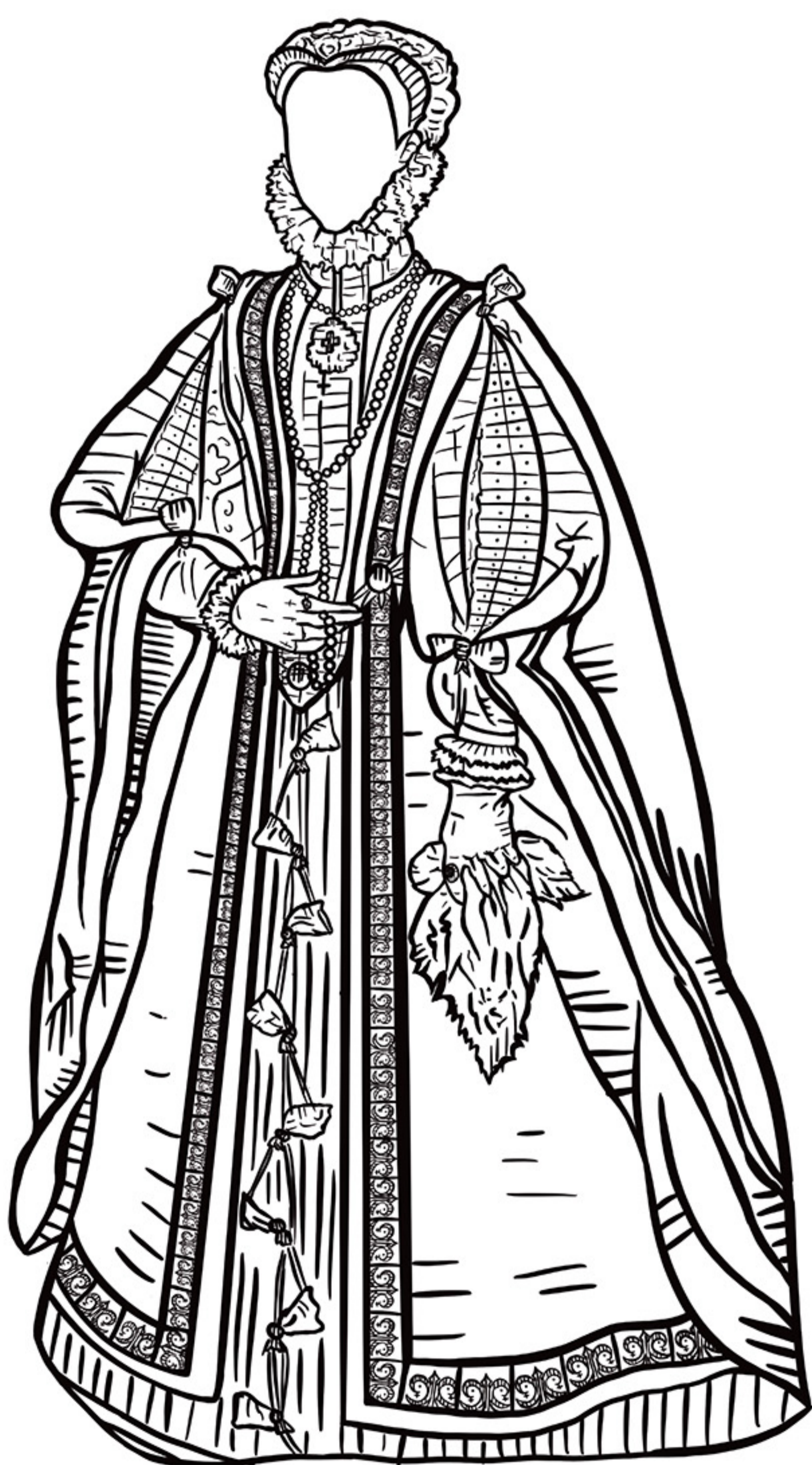
Recreación imagen de la época