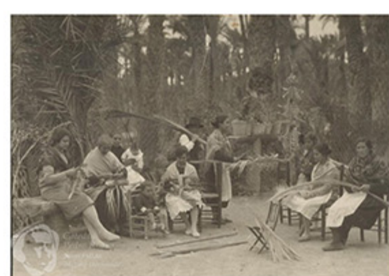
Huerto de San Plácido, mujeres trabajando la palma blanca.