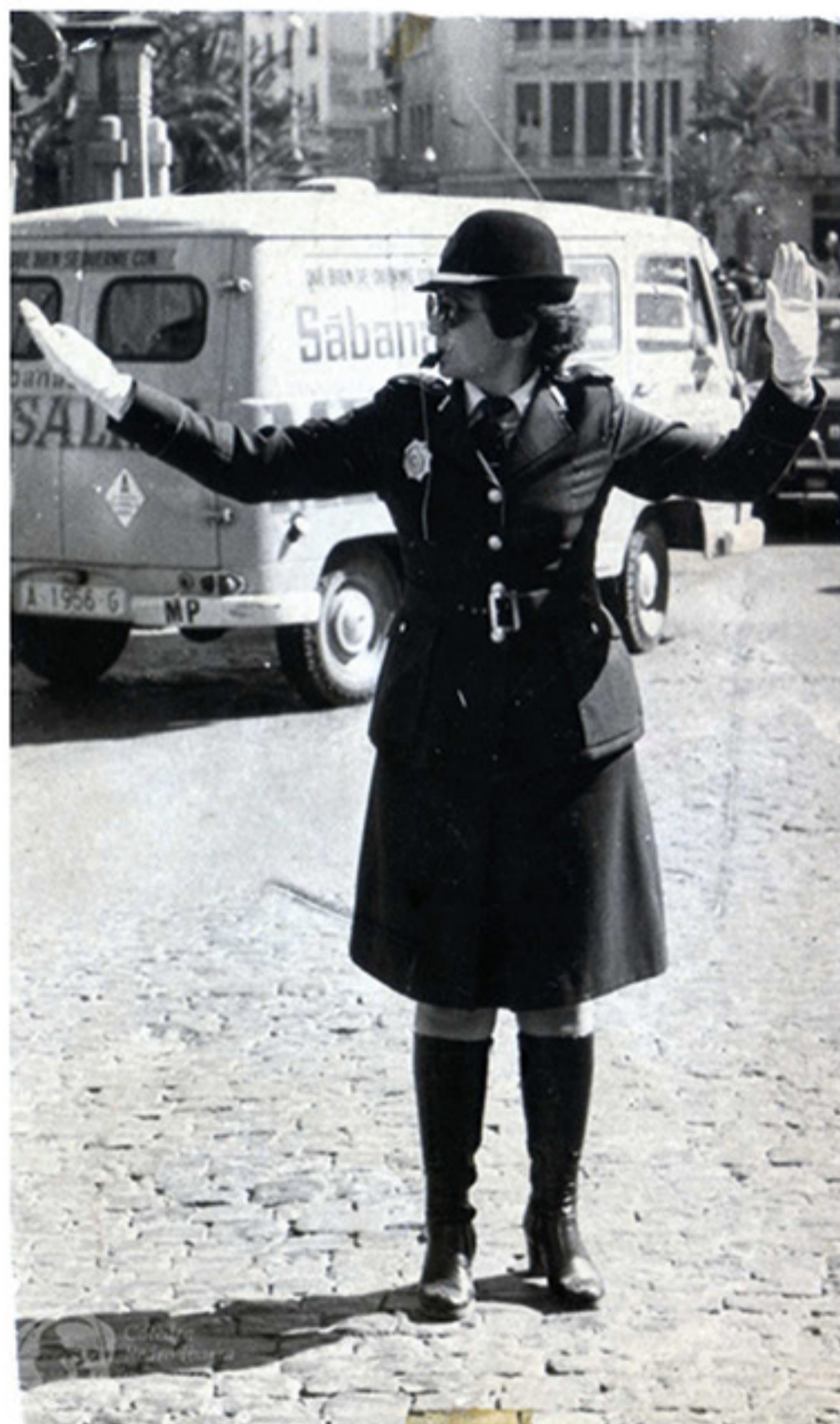
Dirigiendo el tráfico en el puente de Canalejas en 1977.