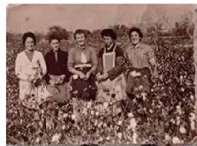
Mujeres recogiendo algodón en el Camp d'Elx.

En la siguiente muestra podemos ver mujeres del Camp d'Elx trabajando en la explotación familiar, mujeres asalariadas y, por último, mujeres en sus propias empresas, tanto en el sector agrícola como ganadero, que es lo más frecuente hoy en día.