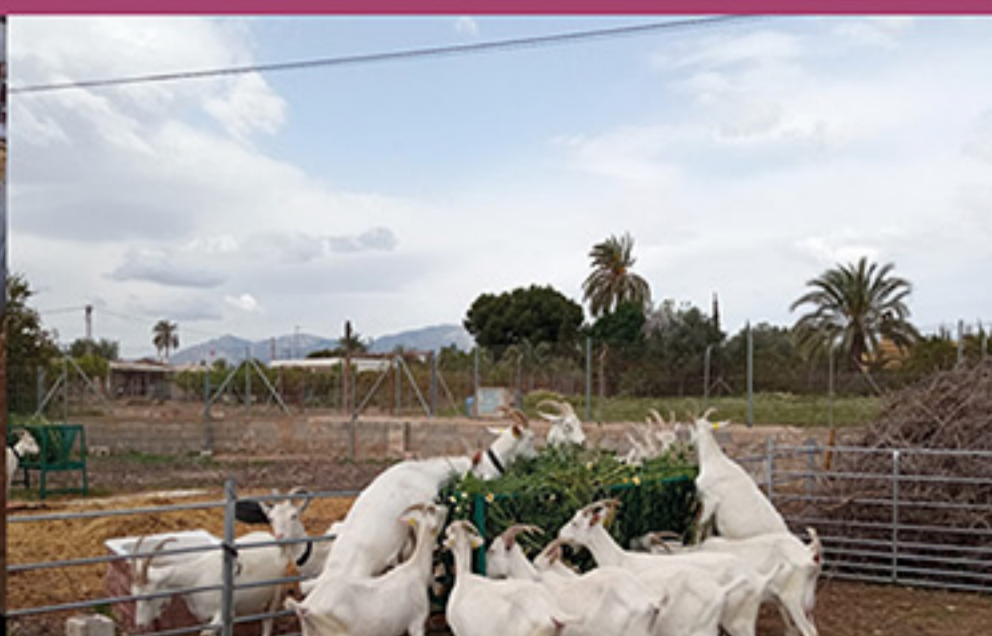
Ganadería Lacabrera Matola, Elche

Además de esta función productiva, la mujer rural es la responsable de la conservación y transmisión de multitud de tradiciones culturales que han visto su continuidad en el tiempo gracias a su labor y tesón prestado a las mismas: gastronomía, labores artesanas... Por último, en el desarrollo de su función productiva, las mujeres rurales muestran preferencia por sistemas de producción respetuosos con el medio ambiente, como es el caso de la agricultura y ganadería ecológicas.