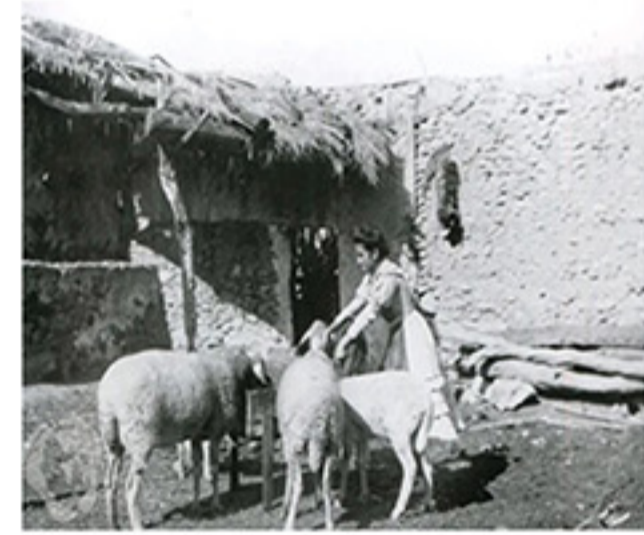
Mujer cuidando de los animales en casa de campo. Imagen: Gullibert Requena, Jerónimo. "Las fotografías del historiador Pedro Ibarra y Ruiz. Un patrimonio recuperado". Cubical Ediciones, 2014. p. 271.

La transformación del mundo rural pasa por el cambio del papel y posición de la mujer en el mismo, como elemento necesario e imprescindible para el avance y desarrollo del ámbito rural. Ejemplos de mujeres rurales actuales de nuestra ciudad: