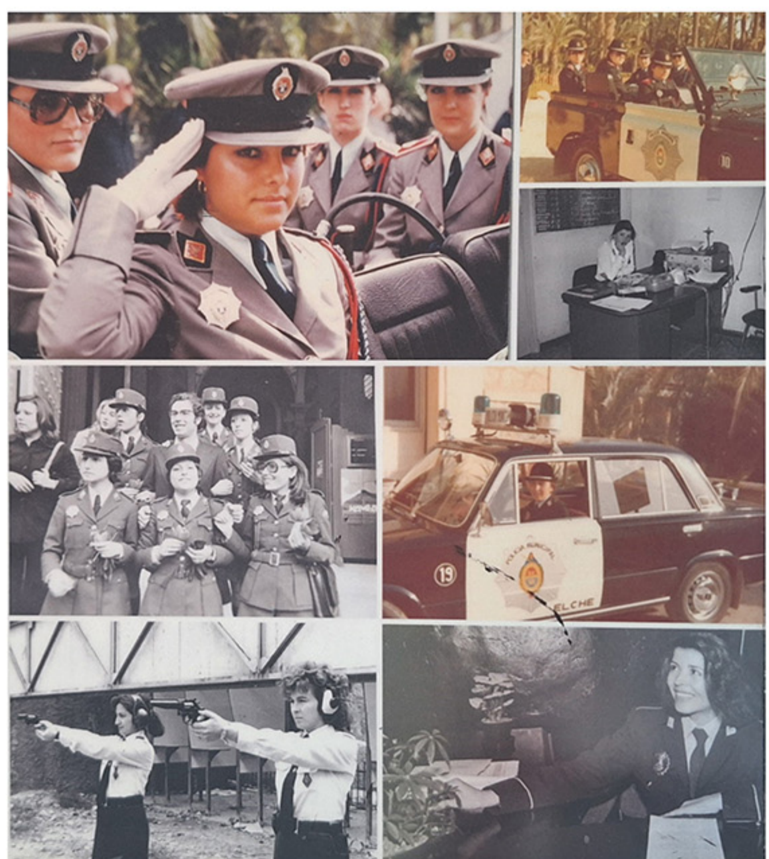
Collage cedido por Bienvenida Tomé.