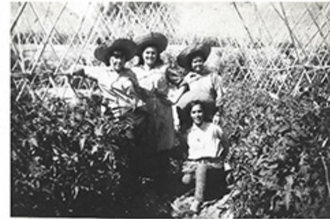
Mujeres en el cultivo de tomates (Asaja Mujeres)