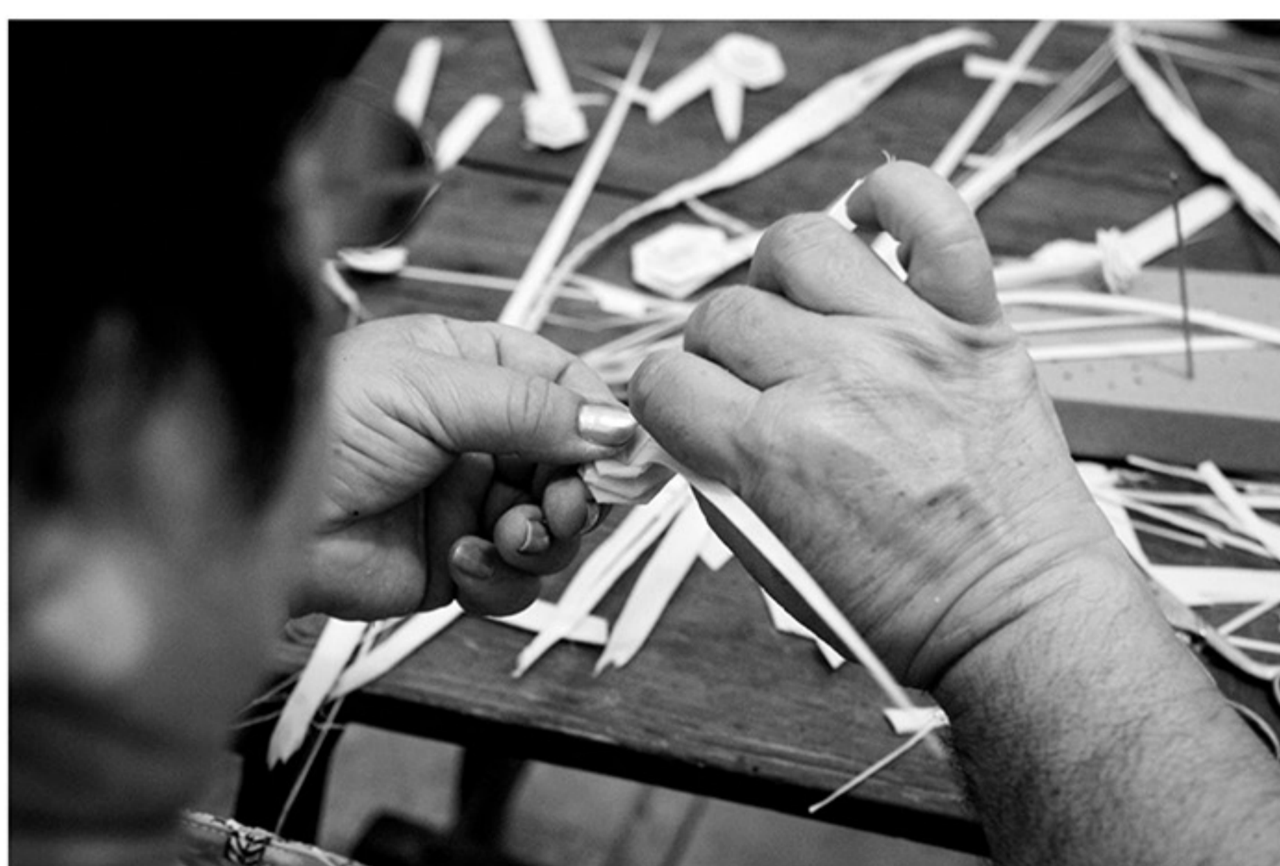
Mujer trabajando la Palma Blanca.